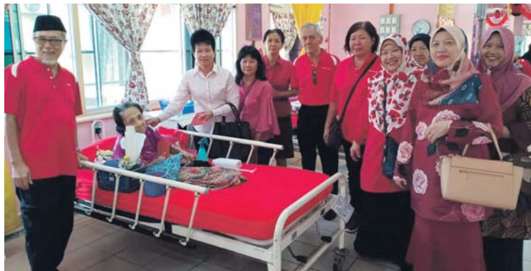
Lawatan kasih disertai masyarakat berbilang kaum bagi meraikan warga emas di rumah kebajikan itu.

Menurutnya, sikap saling menghormati penting untuk keharmonian hidup dan perlu dipertahankan seperti yang diamalkan dalam ma-