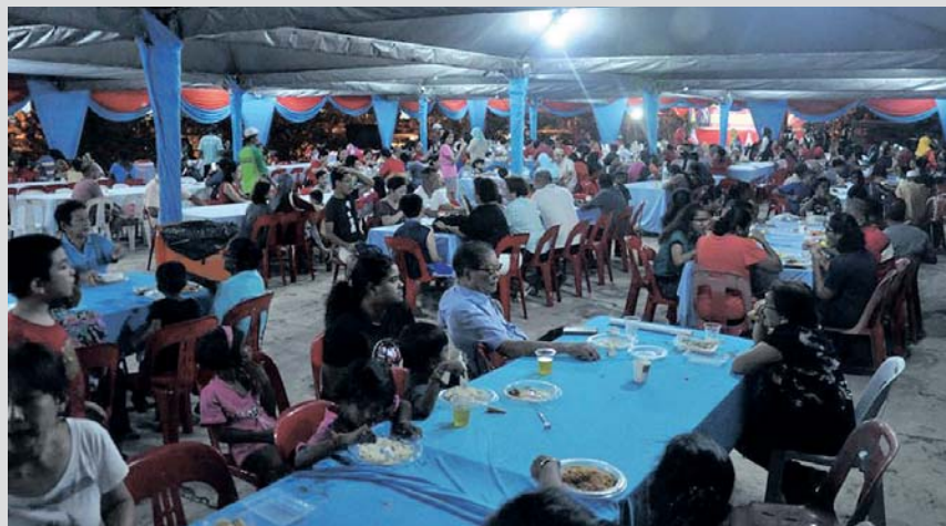
Masyarakat pelbagai kaum hadir di Rumah Terbuka Tahun Baharu Cina Dun Sungai Kandis, Jumaat lalu.

Turut diadakan penyerahan angpau kepada kanak-kanak serta 30 warga emas yang menjadi tradisi perayaan berkenaan.