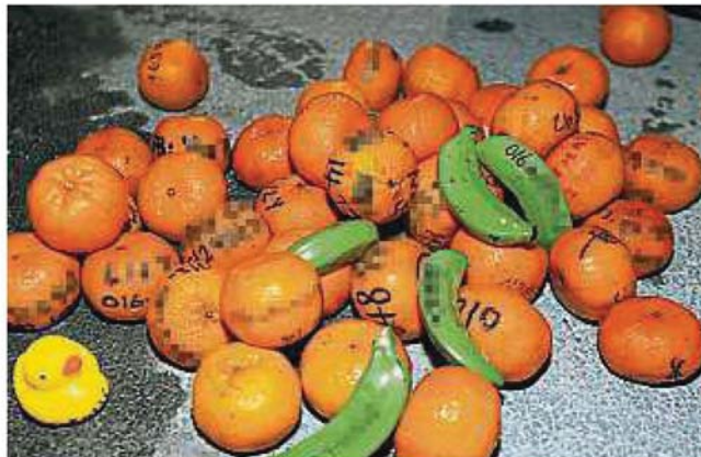
柑给出席者。(档案照) 八打灵再也市政厅将准备4000粒年

仁嘉隆佛光山东禅寺则在元宵节当晚7时30分进行文化表演，而平安灯会将于晚上9时进行圆满传灯仪式，入场免费。