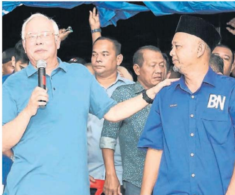
■ 納吉（左起）出席與民會面活動，為扎卡利亞站台造勢。

他希望人民透過選舉，教訓和懲罰欺騙人民的希盟政府，並呼吁人民被騙一次就好，別再繼續受騙，並促請政府別再當人民是傻子。