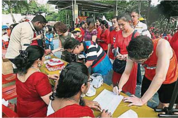
出席民眾踴躍簽名，要求梳邦再也市議會重新開放柏西蘭格華芝班交通樞紐右轉至沙亞南大道的路口。

(沙亞南18日訊)雪州行政議員甘納巴迪勞促請梳邦再也市議會重新檢討關閉柏西蘭格華芝班交通樞紐右轉至沙亞南大道的路口的決定，並且聆聽首邦市以外人民的心聲。