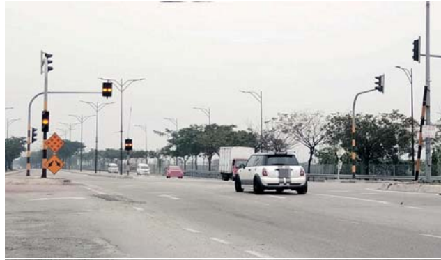
Penduduk dakwa lampu isyarat rosak mengakibatkan satu kemalangan maut di kawasan itu.

agak sebab lampu berkenaan hanya menunjukkan warna kuning sepanjang masa, apatah lagi jalan itu sering digunakan banyak kenderaan berat dari kilang di kawasan berke-