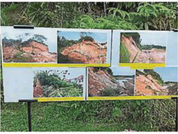
↑居民在对话会上图文并茂展示山壁自去年12月起，如何变本加厉的塌陷。