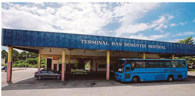
Kedaaan persekitaran Terminal Bas Semenyih Sentral yang terbiar tanpa kehadiran bas dan penumpang.