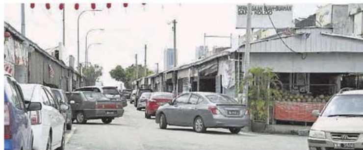
位，每日的车流量非常高。為食街聚集數十個熟食攤

有鑒於此，他決定在蓮花苑1/2路街接為食街的路口，設置一個禁止10噸或以上重型羅厘進入的告示牌，獲得為食街小販一致贊賞。