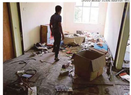
Bahagian atas terminal penuh dengan sampah dan berbau busuk.